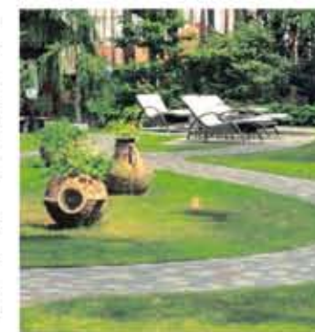
Würth-Hochenburger bringt Stil in Ihren Garten und auf Ihre Terrasse.

Frühlingserwachen im Garten. Jetzt ist der ideale Zeitpunkt für die Vorbereitung der Gartensaison und Würth-Hochenburger, kurz WH, ist der richtige Ansprechpartner im Bereich Garten- und Terrassengestaltung. Das umfangreiche Produktsortiment umfasst neben diversen Gartenbaustoffen aus Naturstein, Sichtschutz- und Zaunelementen, Terrassendielen, etc., auch unzählige Grün- und Blühpflanzen sowie Gartengeräte. Das Thema „Gartenteich“ ist heuer topaktuell. Die WH-FachberaterInnen informieren gerne über die richtige Standortwahl und die neuesten Teichpflegeprodukte für eine gesunde Teichflora und -fauna. Seit über 90 Jahren legt Würth-Hochenburger großen Wert auf moderne Qualitätsbaustoffe und fachkundige