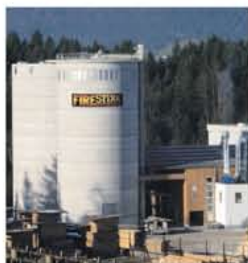
Das FireStixx-Werk in Abtenau produziert nach modernsten technischen Standards.

Wer sich für eine Pelletsheizung entscheidet, schont die Umwelt und seine Geldbörse. Für FireStixx Premium-Pellets werden ausschließlich Rohstoffe aus nachhaltig bewirtschafteten Wäldern verwendet. Dies garantiert, dass der Wald als Lebensraum für Mensch, Tier und Pflanzen erhalten bleibt. Bei der Verbrennung von Holzpellets wird nicht mehr CO 2 freigesetzt, als zuvor vom Baum gespeichert wurde. Wichtig ist die Qualität der Holzpellets, denn eine geringe Pressdichte und ein hoher Staubanteil können der Heizung schaden. Grundvoraussetzung einer Pelletsproduktion für