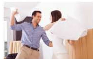
Den Kampf der Geschlechter gewinnen die Frauen, denn sie sind zahlenmäßig mehr.